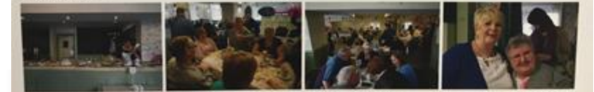
一人入居のイベント「コーヒーマッチアップ」上、定額入居が可能なカフェで開かれた。 参加者から心から楽しんで、音楽とダンスが盛んなパーティーが開かれた。 この日心算にしている人がたくさん、 音楽は高齢の人と、スタッフと児童を結びつける。

ヘイウッド・ミドルトン・ロッチデール・サークル(HMRCサークル)は、地域に暮らす住民(特に高齢者)が社会から孤立したり孤独感を抱えることを防ぎ、自分らしく暮らせるように小さな集まりごとを互助するサークルです。年会費を支払うと、会員同士が参加する日帰り旅行やジャズの演奏会などのイベントに参加できたり、ランチやティータイムなど、様々な社交の機会を得られます。さらに買い物や車の手入れなど、日常生活で困った時も助けてもらえます。 こうしたしくみは、困りごとを抱えた当事者である高齢者とともにつくりました。その過程で高齢者が性別、人種に関係なく同じ興味や関心を持つ人とつながることを強く求めていることが分かったので、高齢者の困りごとを助けるだけでなく、逆に高齢者ができることややりたいことを提供することもできるサービスも目指したのです。このサークルはいま全国へと広がり、規模も徐々に大きくなってきています。