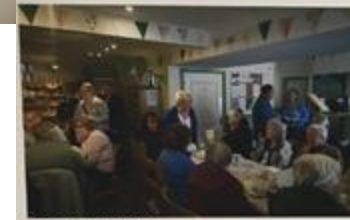
高齢者の集い場で、さまざまな

ヘイウッド・ミドルトン・ロッチデール・サークル(HMRCサークル)は、地域に暮らす住民(特に高齢者)が社会から孤立したり孤独感を抱えることを防ぎ、自分らしく暮らせるように小さな集まりごとを互助するサークルです。年会費を支払うと、会員同士が参加する日帰り旅行やジャズの演奏会などのイベントに参加できたり、ランチやティータイムなど、様々な社交の機会を得られます。さらに買い物や車の手入れなど、日常生活で困った時も助けてもらえます。 こうしたしくみは、困りごとを抱えた当事者である高齢者とともにつくりました。その過程で高齢者が性別、人種に関係なく同じ興味や関心を持つ人とつながることを強く求めていることが分かったので、高齢者の困りごとを助けるだけでなく、逆に高齢者ができることややりたいことを提供することもできるサービスも目指したのです。このサークルはいま全国へと広がり、規模も徐々に大きくなってきています。